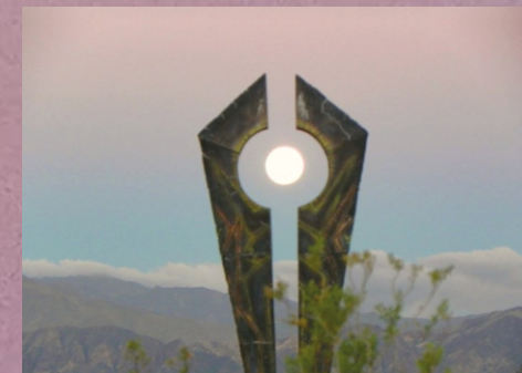
"Mirador de la luna de otoño" FAUSTO MARAÑÓN