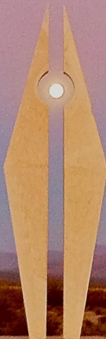
"Mirador de la luna de verano" FAUSTO MARAÑÓN