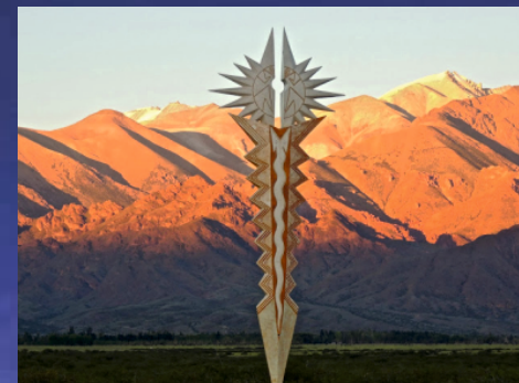
“Mirador del sol” FAUSTO MARAÑÓN