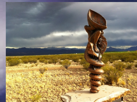
“Metamorfosis” FAUSTO MARAÑÓN