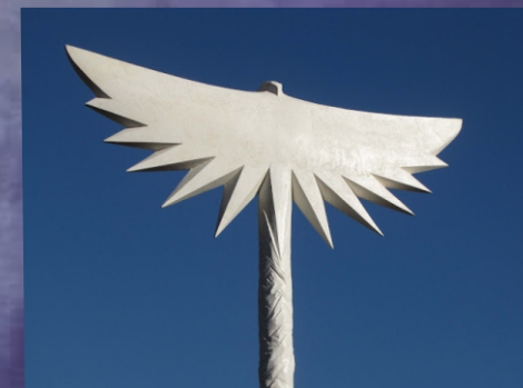
“Águilas del sol” FAUSTO MARAÑÓN