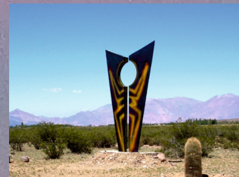
"Mirador de la luna de invierno" FAUSTO MARAÑÓN