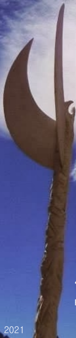
“Águilas” FAUSTO MARAÑÓN

Desde el punto de vista ecológico, este proyecto apunta a generar una nueva modalidad de contactarse con la naturaleza a través de la expresión artística en un diálogo contemplativo con el hombre.